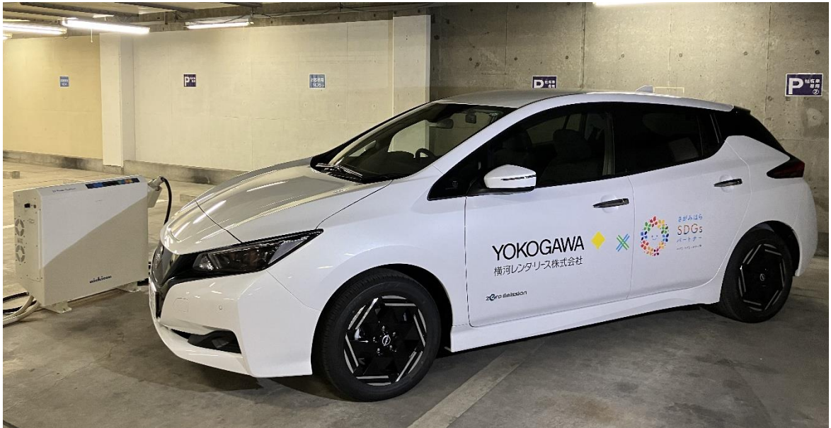
(VPP実証事業イメージ)