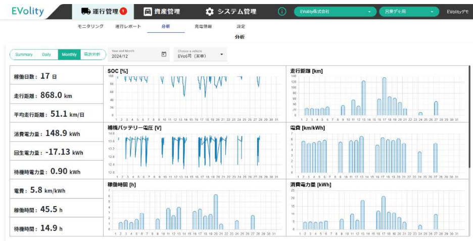
<フリートマネジメントシステム (月次分析の画面)>