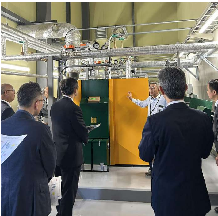
木質チップボイラの見学

同ホームでは、建物の構造材に足寄町産カラマツをメイン構造とした大断面集成材を活用することで地産地消に取り組んでいます。また、木質チップボイラの導入により、同ホームにて必要となる熱エネルギーに関して、町内に豊富に存在する未利用の木質バイオマスエネルギーを熱源として活用することで、CO 2 の削減とエネルギーの循環による環境負荷の軽減を図っています。