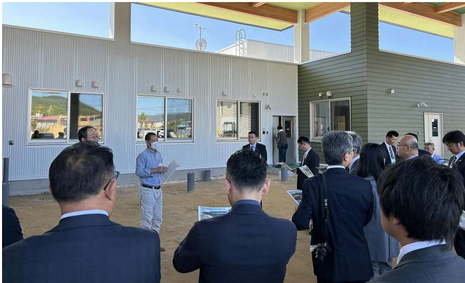
当日の視察の様子

同ホームでは、建物の構造材に足寄町産カラマツをメイン構造とした大断面集成材を活用することで地産地消に取り組んでいます。また、木質チップボイラの導入により、同ホームにて必要となる熱エネルギーに関して、町内に豊富に存在する未利用の木質バイオマスエネルギーを熱源として活用することで、CO 2 の削減とエネルギーの循環による環境負荷の軽減を図っています。