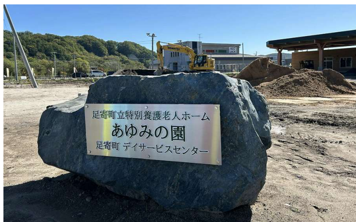
建設中の足寄町立特別養護老人ホーム「あゆみの園」足寄町デイサービスセンター

寄附金贈呈式は足寄町役場にて開催。また、贈呈式後には足寄町内にて今後オープンを予定する特別養護老人ホーム視察の中で実際に木質バイオマスエネルギーを熱源として利用する取り組みを見学しました。